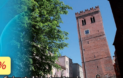
Gminy atrakcyjne turystycznie