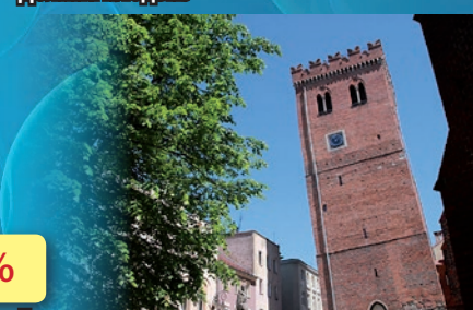
Гмины привлекательные для туризма