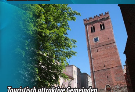
Touristisch attraktive Gemeinden