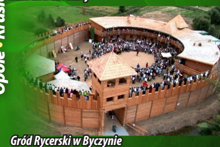
Gród Rycerski w Byczynie