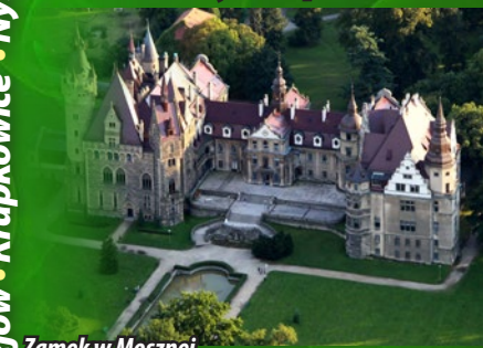
Zamek w Mosznej