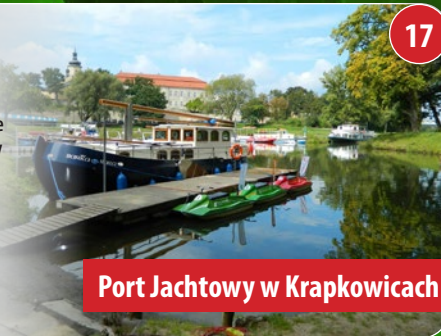
Port Jachtowy w Krapkowicach

Zjeżdżalnia Grawitacyjna Alpin Coaster o długości pętli 600 metrów. Konstrukcja zjeżdżalni gwarantuje bezpieczną zabawę dla całej rodziny. Oświetlony cały tor, przeznaczony do jazdy wieczornej.