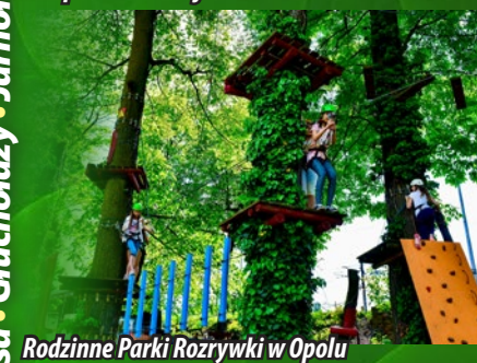
Rodzinne Parki Rozrywki w Opolu