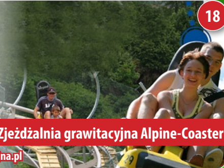
Zjeżdżalnia grawitacyjna Alpine-Coaster

Zapraszamy całe rodziny do spędzenia wolnego czasu w Stumilowym Lasku. Wśród atrakcji najmłodszy odkryją: bajkowe domki mieszkańców Lasku, Bajkową Trasę, domek Hobbita, wioskę Indian, statek piracki, kolorowe wózeczki, którymi można pojeździć po Lasku, lokomotywę „Kubuś Express”, a także wiele innych!