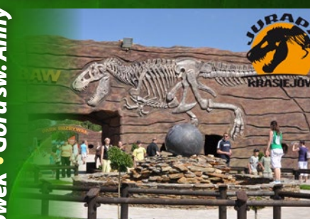
Jurapark w Krasiejowie

Opole • Krasiejów • Krapkowice • Nysa • Glucholazy • Jarnołtówek • Góra św. Anny