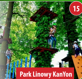
Park Linowy KanYon

Jeden z największych obiektów na Opolszczyźnie - trzy klimatyzowane sale o łącznej powierzchni 1200 m 2 , z niepowtarzalnymi atrakcjami dmuchanymi, trampolinami, basenem z gąbkami. Dodatkowo, sala z ponad 20 automatami do gier zarówno dla dorosłych, jak i dzieci. Zapraszamy codziennie od 11:00 do 20:00