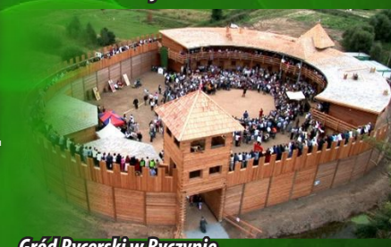
Gród Rycerski w Byczynie