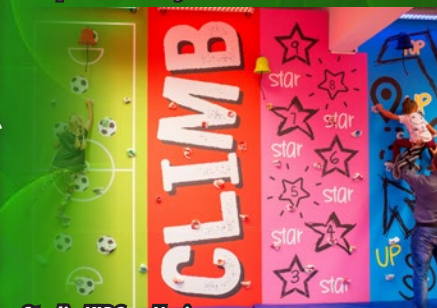
Studio KIDS w Nysie