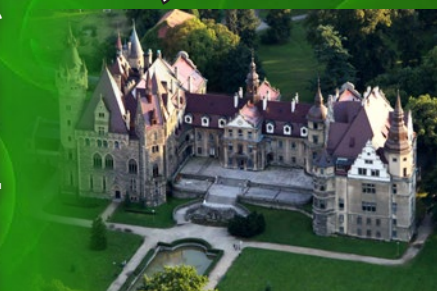
Zamek w Mosznice