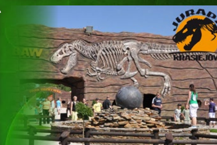
Jurapark w Krasiejowie

Opole • Krasiejów • Krapkowice • Nysa • Glucholazy • Jarnołtówek • Góra św. Anny