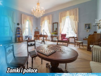
Zamki i pałace