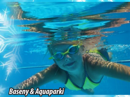
Baseny & Aquaparki